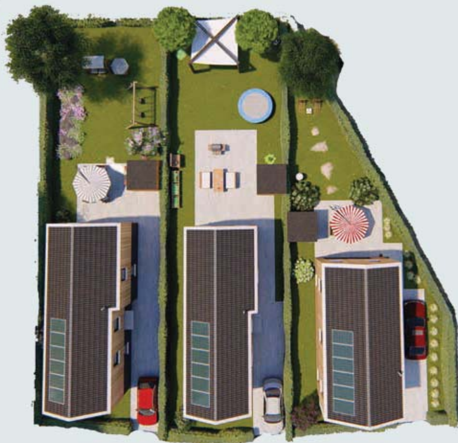
Woning 01 Type A