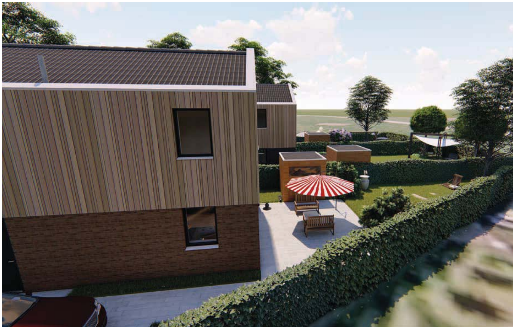
Impressie Zijgevel en achtertuin