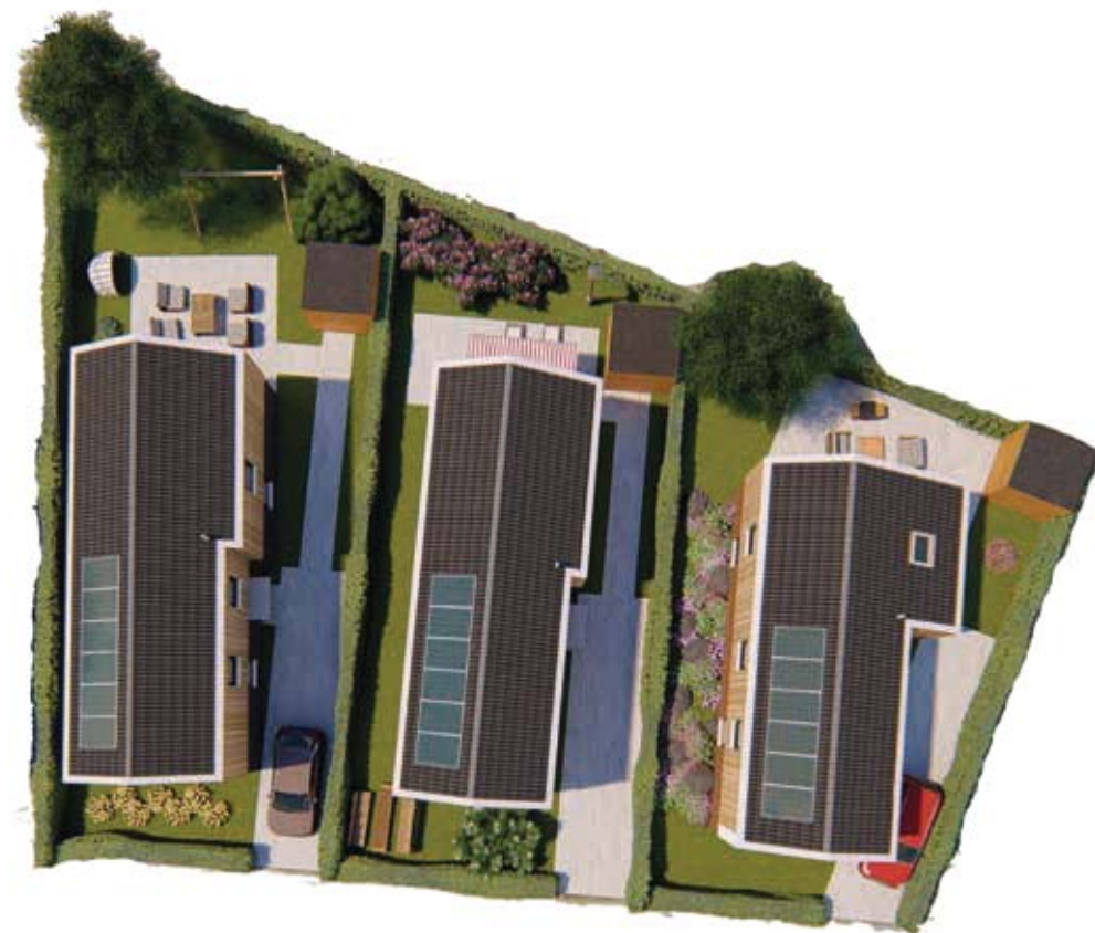
Woning 04 Type A