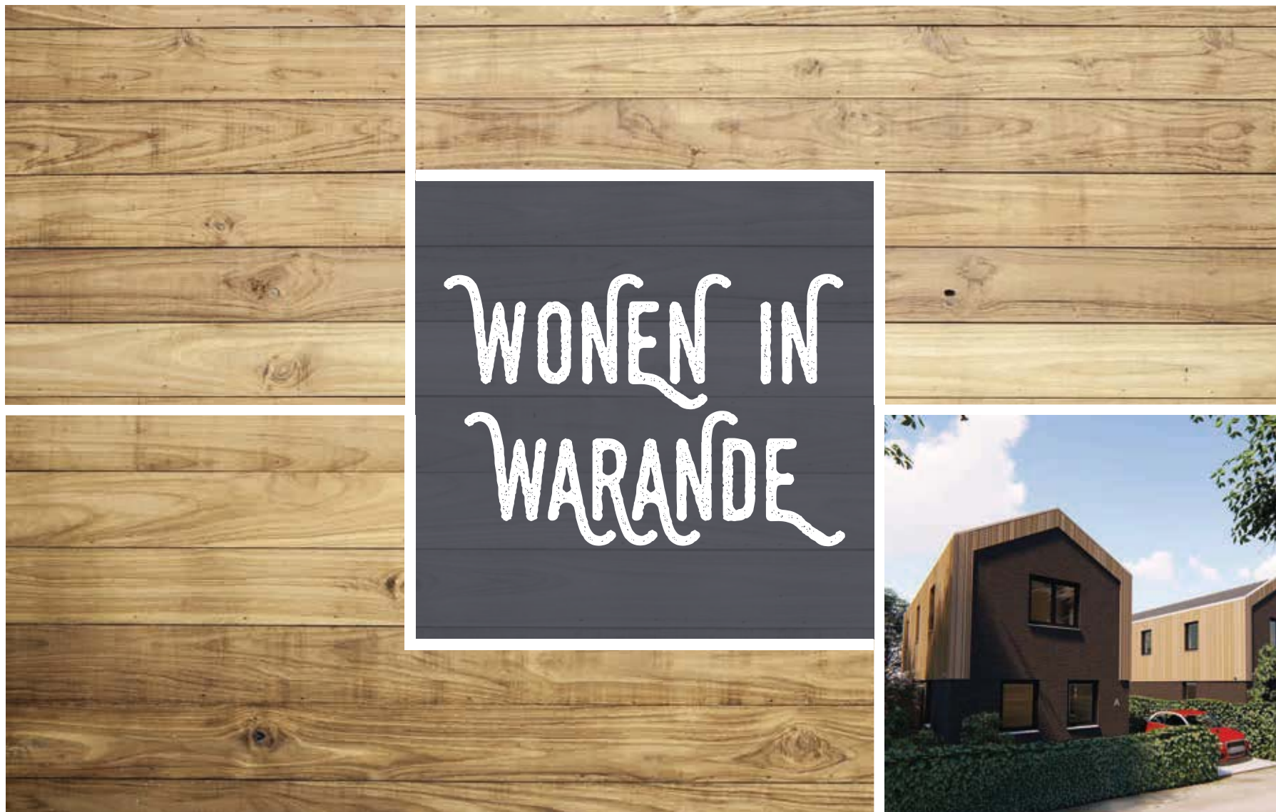
6 VRIJSTAANDE WONINGEN AAN DE ZEEPKRUIDSTRAAT WARANDE TE LELYSTAD