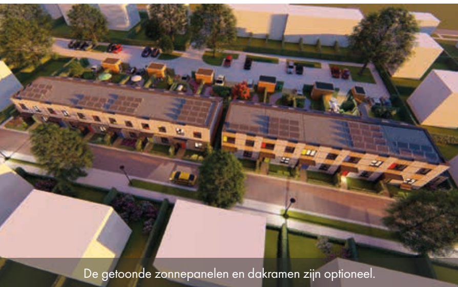
De getoonde zonnepanelen en dakramen zijn optioneel.

"Uw woning wordt compleet en luxe afgewerkt met hoogwaardige materialen."