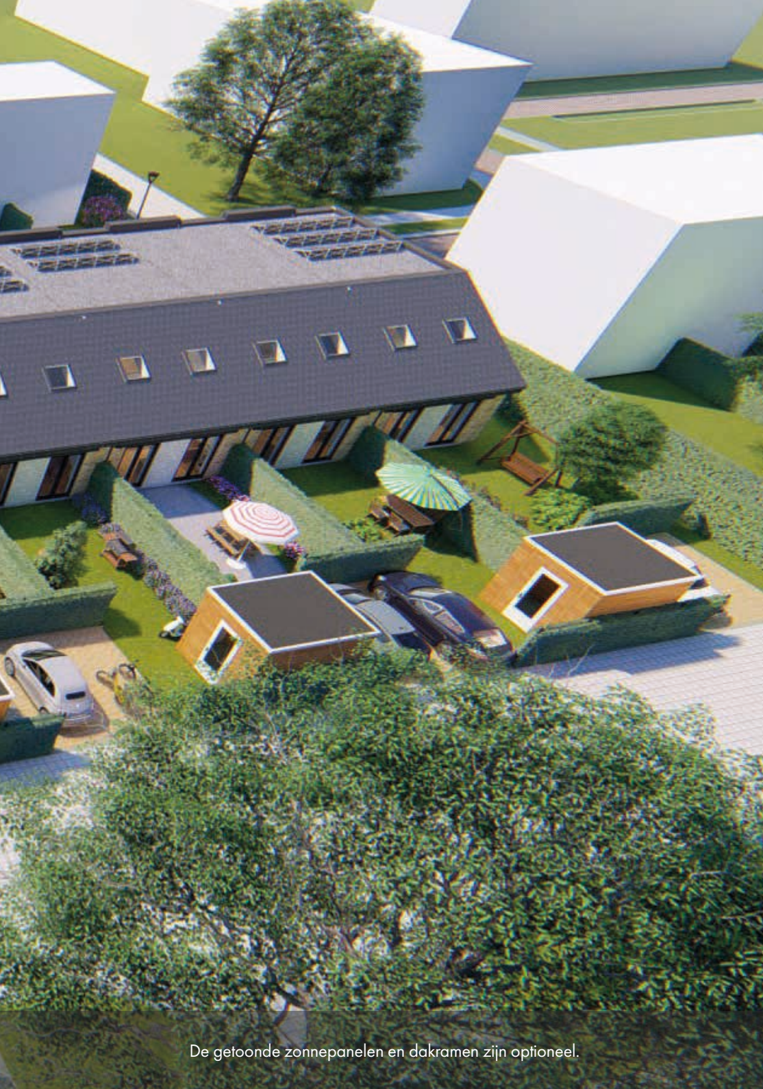
De getoonde zonnepanelen en dakramen zijn optioneel.