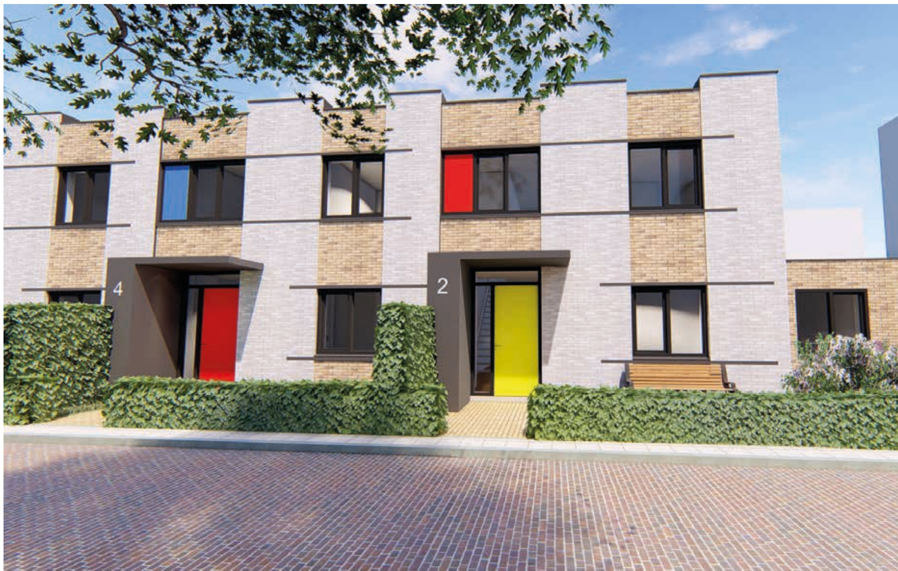
IMPRESSIE Klaproos ■ Voorzijde