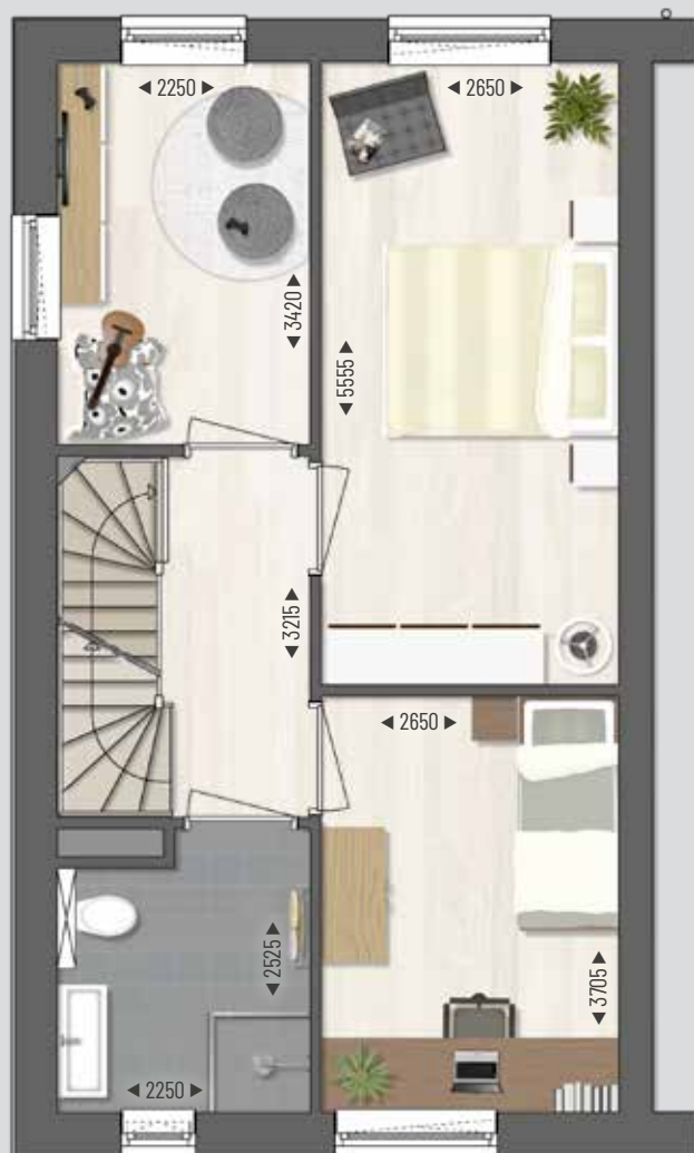
EERSTE VERDIEPING Schaal 1:75 ■ Maten in mm