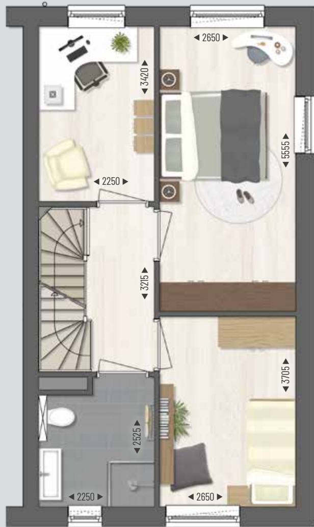
EERSTE VERDIEPING Schaal 1:75 ■ Maten in mm