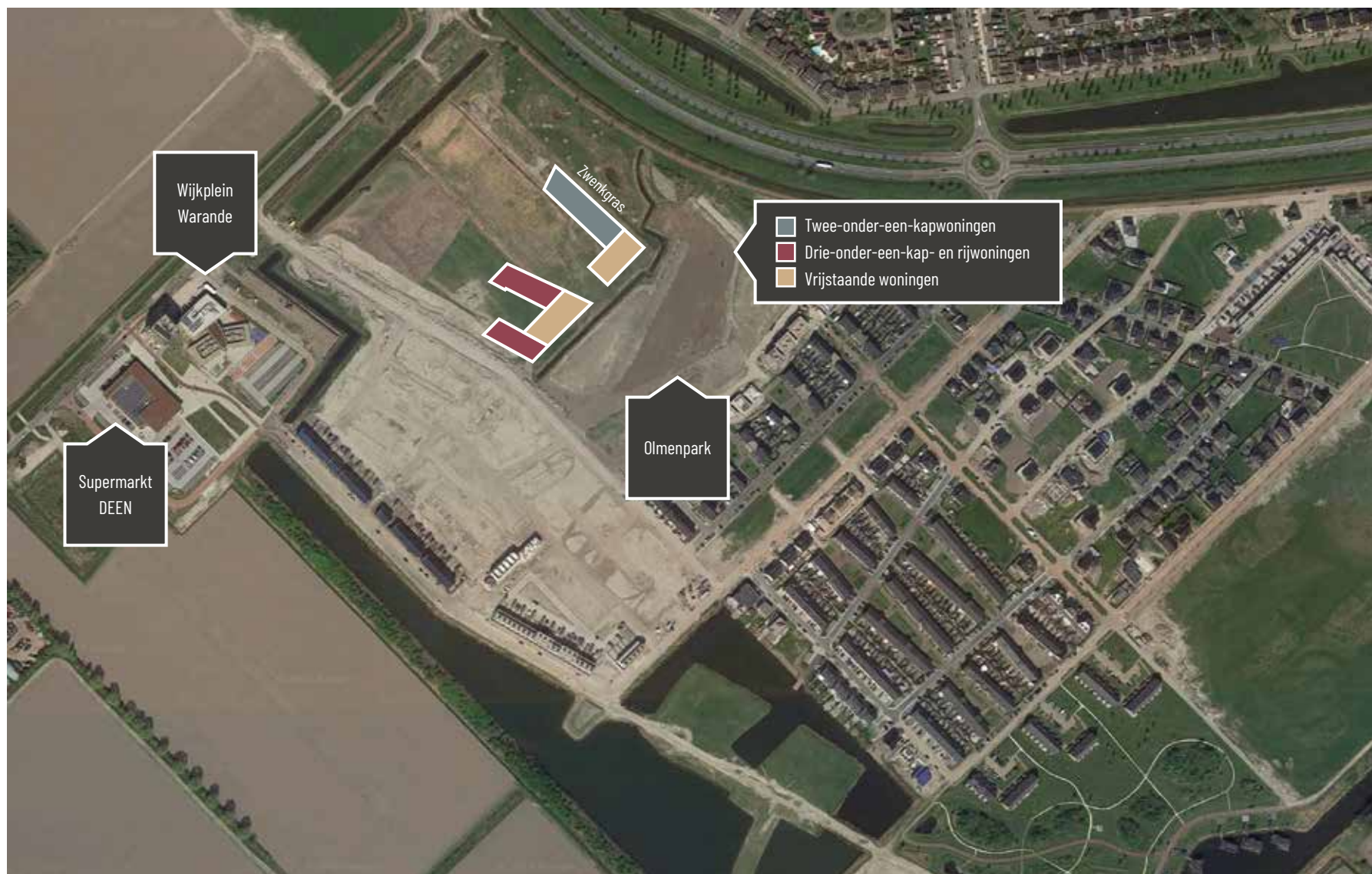
LUCHTFOTO Warande Lelystad

Lelystad heeft de ruimte en vrijheid. Tevens is er een goede verbinding met de Randstad. Via de vernieuwde A6 of de directe treinverbinding ben je in circa 35 minuten op Amsterdam Centraal.