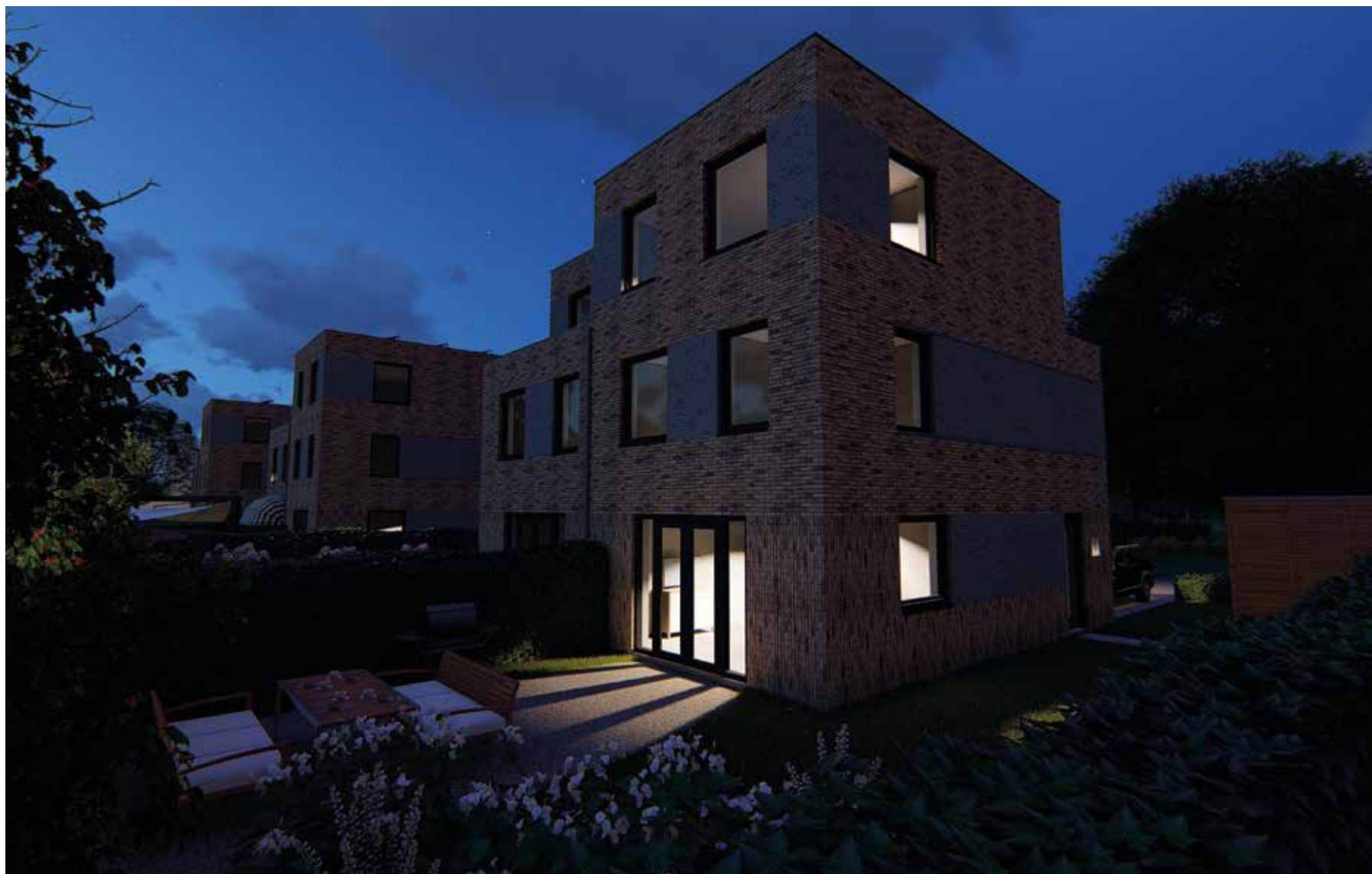
IMPRESSIE Zwenkgras ■ Achterzijde